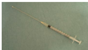
※人工授精用チューブ